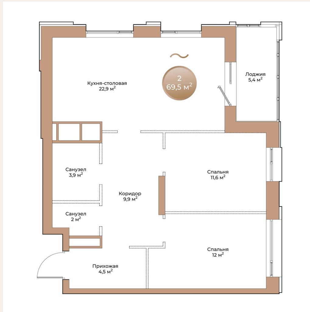
ВИД ВО ДВОР